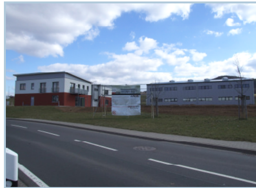
Bisher investierte das Unternehmen rund zwei Millionen Euro in den neuen Standort.