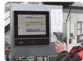
Betriebsdatenerfassung mit externem Barcodescanner. Production data collection with external barcode reader.